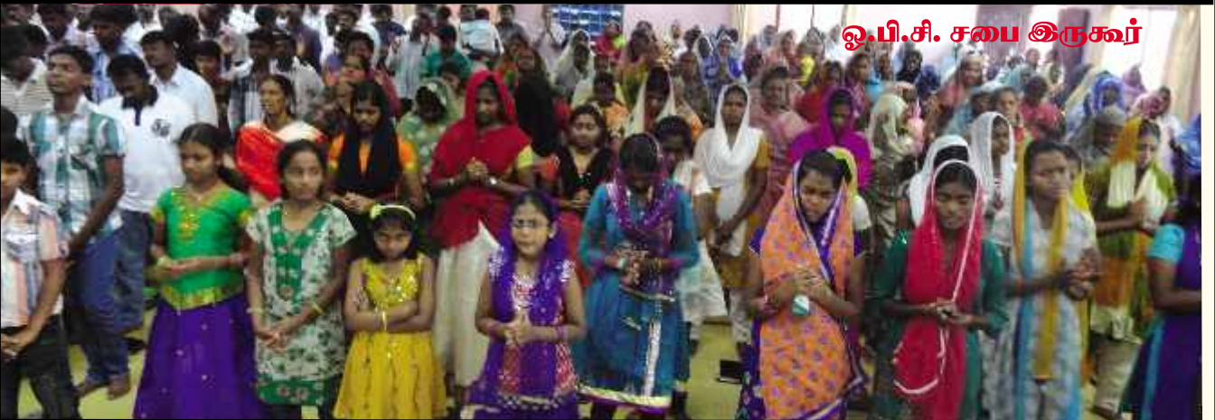
ஓ.பி.சி. சபை இருகூர்