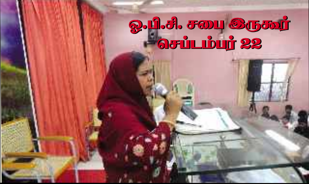
ஓ.பி.சி. சபை இருகூர் செப்டம்பர் 22