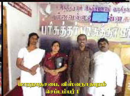
மாரநாதசபை, விஸ்வநாதபுரம் செப்டம்பர் 1