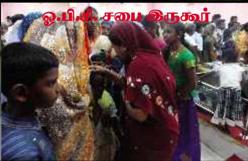
ஓ.பி.சி. சபை இருகூர்