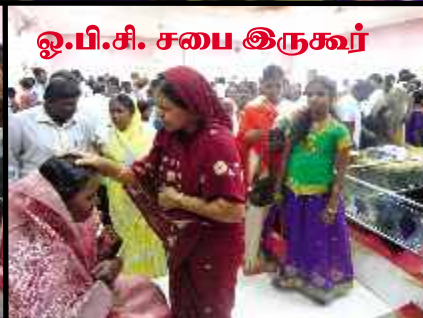
ஓ.பி.சி. சபை இருகூர்