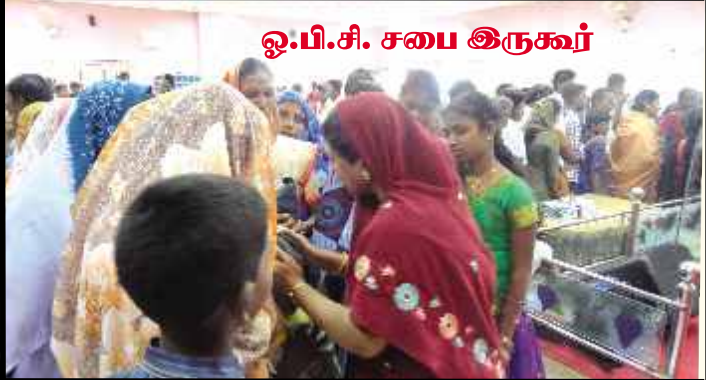
ஓ.பி.சி. சபை இருகூர்