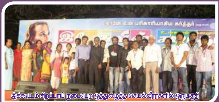
இக்கூட்டம் சிறப்பாய் நடைபெற ஒத்துழைத்த செயல்வீரர்களில் ஒருவர்த்