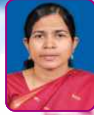
- பொற்செல்வி ராபின்

பிதா, குமாரன், பரிசுத்த ஆவியானவருக்கே மகிமை