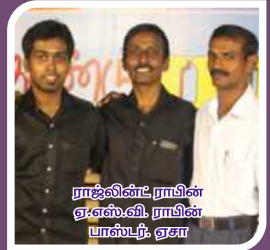
ராஜ்விண்ட் ராபின் ஏ.எஸ்.வி. ராபின் பாஸ்டர். ஏசா