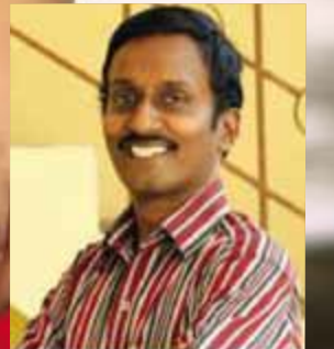
ASV ROBIN Peace of Jesus.org India